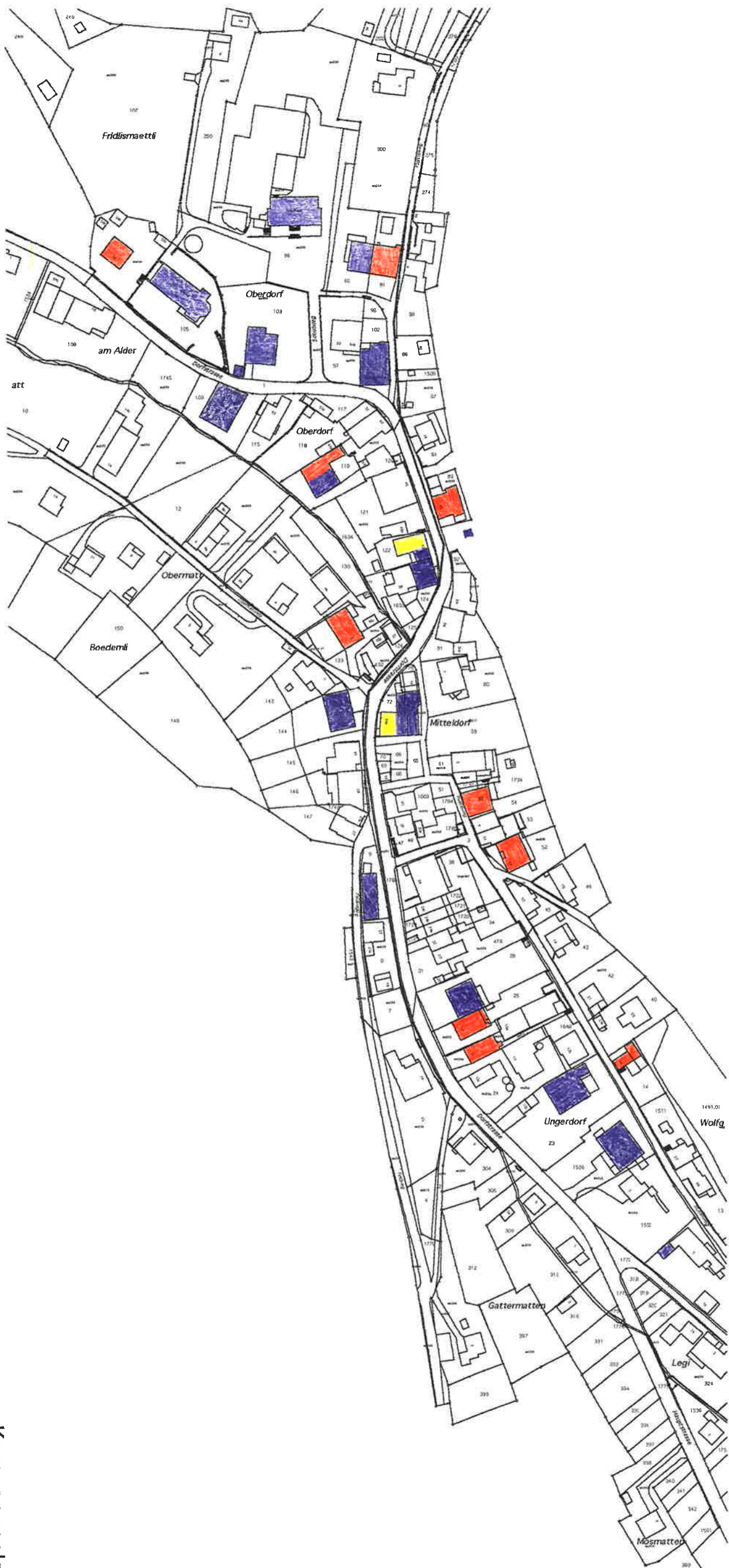
Kernzonenplanung 4243 Dittingen