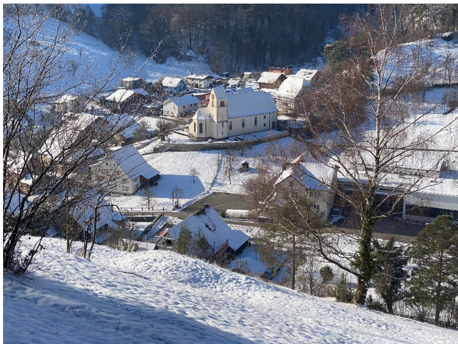
Winterstimmung in Dittingen