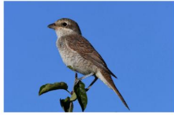
Neuntöter Weibchen

In der Reinacher bzw. Aescher Ebene findet man Buntbrachen, kleine Feldhölze, Hochstammobstbäume und Kleinstrukturen die Nahrungsgrundlagen und Fortpflanzungsorte für Goldammer, Neuntöter, Dorngrasmücke, Stieglitz und vielem mehr bieten. Auf diesem ornithologischen Rundgang erkunden wir den Naturraum Aesch.