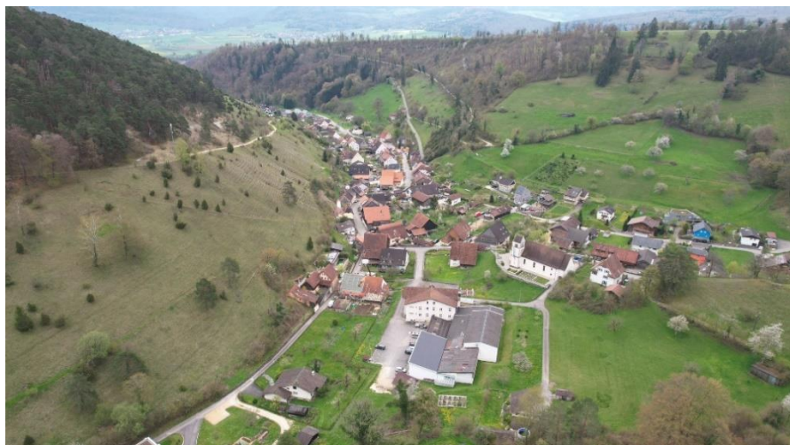
Dittingen aus der Vogelperspektive