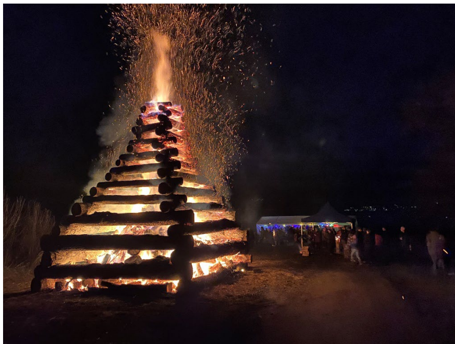
Fasnachtsfeuer auf dem Schiblifels