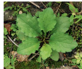
Jungpflanze bodennahe Rosette im ersten Jahr

Achtung: einmaliges Mähen fördert das Wachstum und verschlimmert die Situation