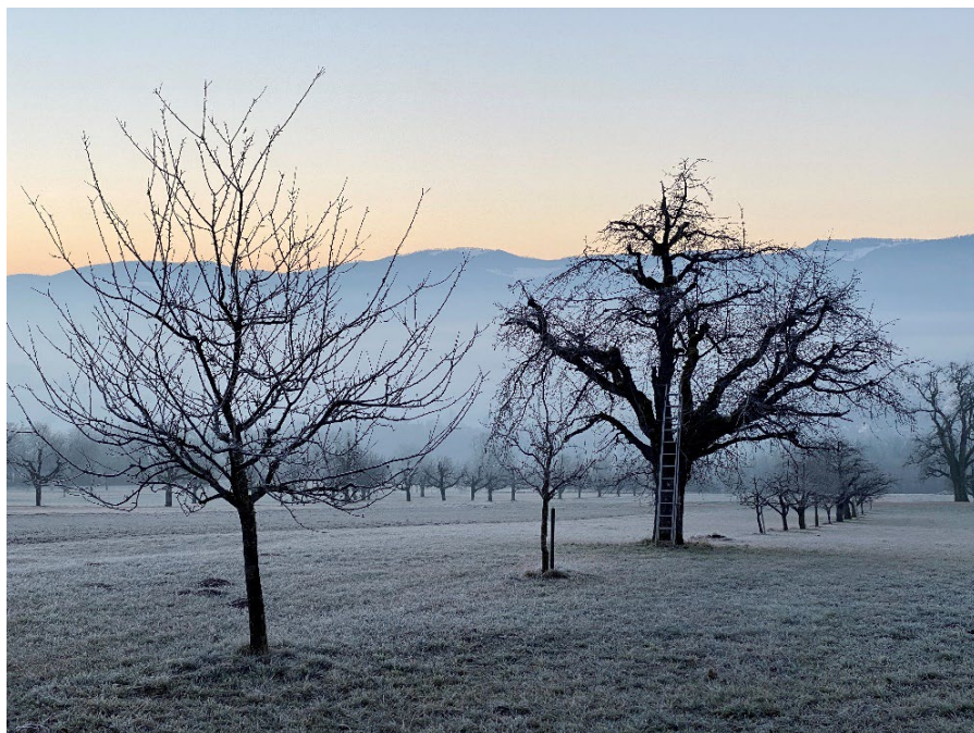
Winterstimmung auf dem Feld