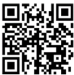
Offizieller Film zu Aktion Sternsingen