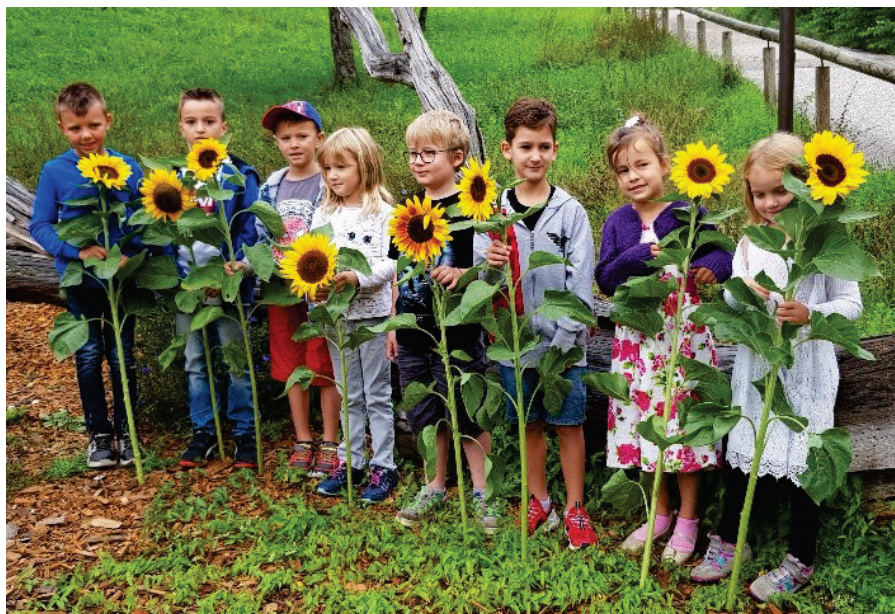
Die neuen 1. Klässler Schuljahr 2019/2020