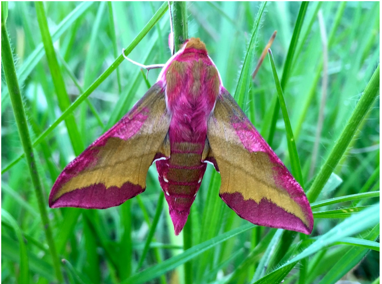
(Weinschwärmer auf dem Feld)