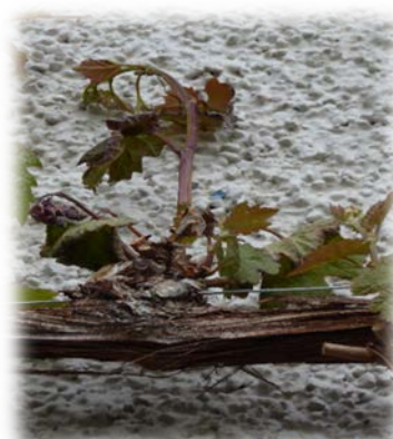
Trauben-Spalier am Haus Hübelweg 2, nur drei Triebe erfroren.