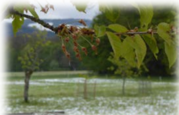
Gladisrüti/Kirschbaum jung, (26.04.17 gerettet)???