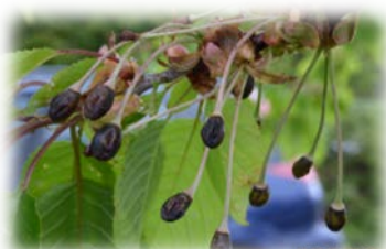
Gladisrüti/Kirschbaum alt, 5 Tage später am 26.04.17 / erfroren!