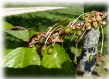
Gladisrüti/Kirschbaum alt, (21.04.17 was passiert?)