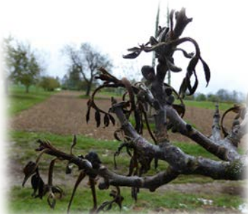
Rüttiweg / Nussbaum gross keine Nüsse zum Sammeln 2017!!