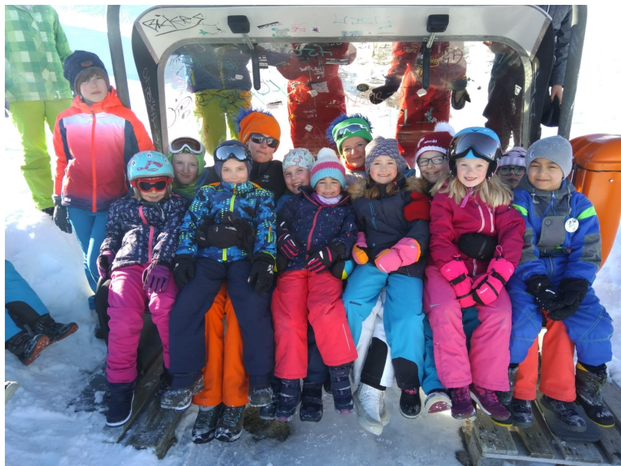
Skilager Primarschule 2019

offizielles Informationsblatt der Gemeinde Dittingen