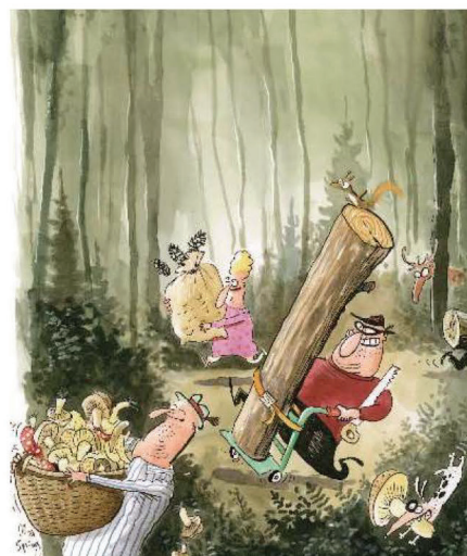
Wir sammeln und pflücken mit Mass