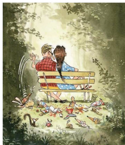
Wir beschädigen und hinterlassen nichts